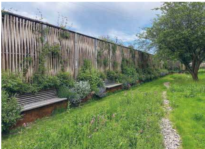
Figur 3: Færdige Grøn Skærm set indefra. Skærmen danner ramme om et nyt grønt rum og skaber en havelignende atmosfære i et tæt bykvarter. (Den tilsluttede bygning ligger mod højre uden for fotoet).

Teknologisk Institut, Københavns Universitet, Københavns Kommune, TL-Engineering, Aarsleff A/S, Malmos A/S og Pilebyg a/s.