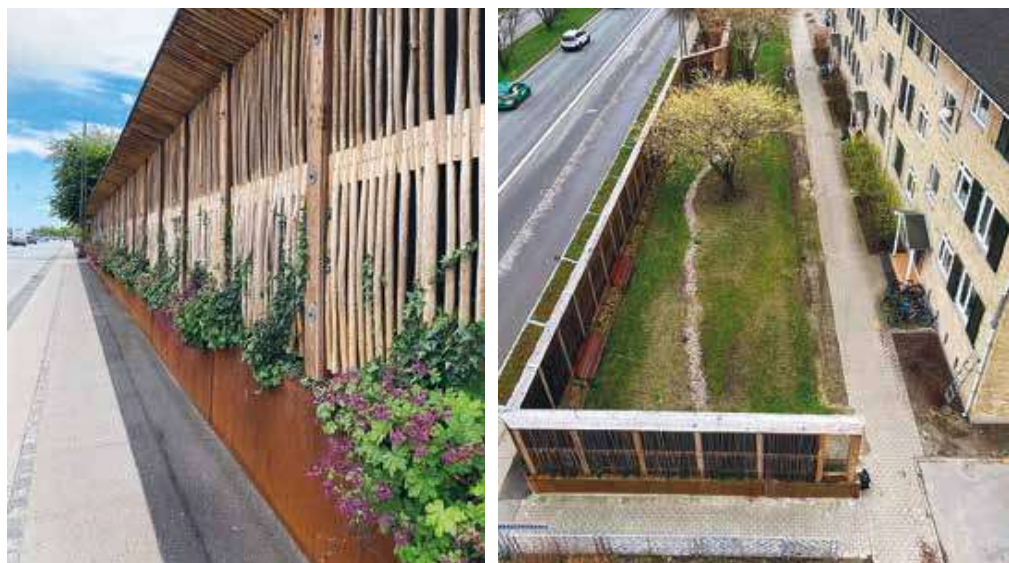
Figur 1: Gadevisning af den urbane Grøn Skærm til højre og en overhead-visning af den færdige struktur til venstre. Tagvand fra bygningen, der ses til højre, ledes via slanger indsat i de fire nedløbsrør under jorden og op til toppen af skærmen, hvor det fordeles og derefter absorberes i mineraluld, placeret i midten af skærmen. Eventuelt overskydende vand håndteres i det nye grønne rum, der ses mellem skærm og bygning.