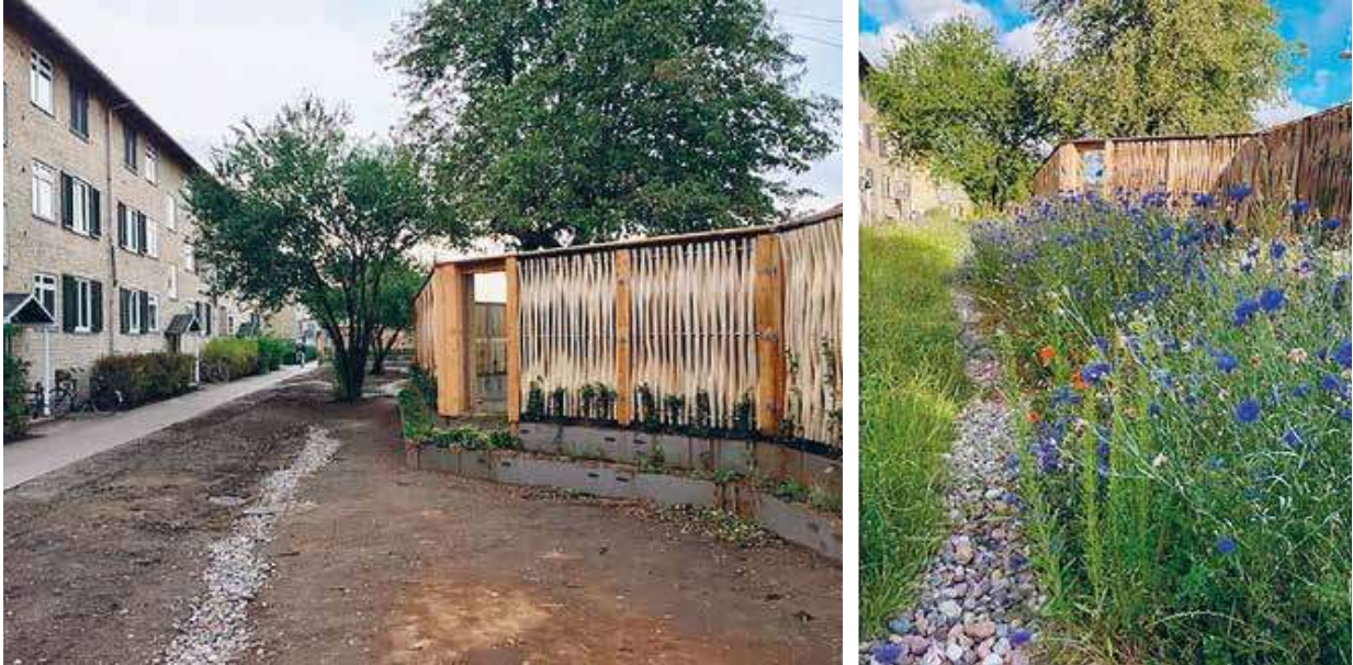
Figur 6: Sammenligning af Grøn Skærm umiddelbart efter opførelsen i 2019 (til venstre) og et år efter i 2020 (til højre). Bemærk det lodrette glasvindue og etablering af blomsterrig vegetation på arealet mellem skærmen og bygningerne.

striel forarbejdning er mulig. Pilestammerne er rette, kraftige og ikke opskåret til lameller, og det er afgørende for at opnå den ønskede levetid, som vurderes at være mindst 30 år. Stål indgår stadig, men i et diskret omfang som de bærende konstruktionsdele. Facader i piletræ har betydet, at skærmene i dag har et 60-67 % lavere CO 2 -aftryk sammenlignet med en konventionel støjskærm udført i stålkassetter, se figur 4.