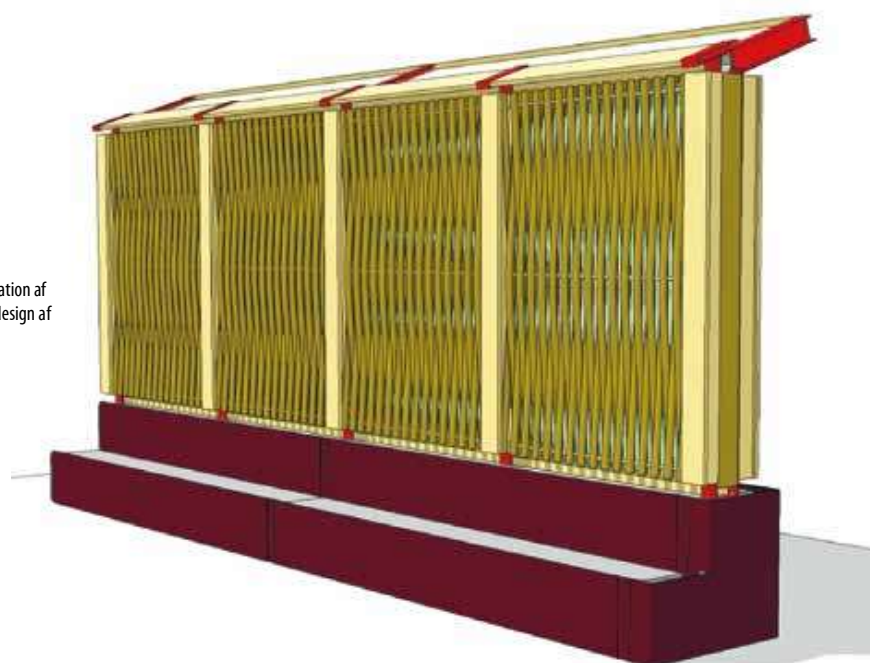
Figur 5: Illustration af det endelige design af Grøn Skærm.

Med Pilebyg A/S' erfaringer med konstruktion af støjskærme, der primært er baseret på træ, lykkedes det at få et design frem, hvor brugen af stål og beton er minimeret, og hvor en betydelig del af materialet er danskproduceret pil. Dyrkningsprincipper og sortering sikrer, at en indu-