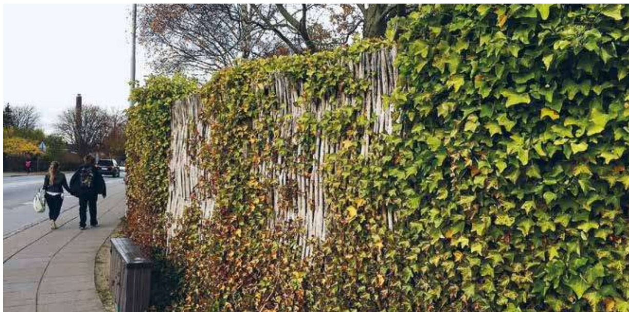
Figur 4: En pilebyg-støjskærm opstillet langs en trafikeret vej.

Fordampningen kan også skabe et sted, hvor folk "kan køle af" om sommeren, og her kan skærmen bidrage til at mindske virkningen af "urban varmeø", hvor byer ofte er betydeligt varmere end det omkringliggende landskab.